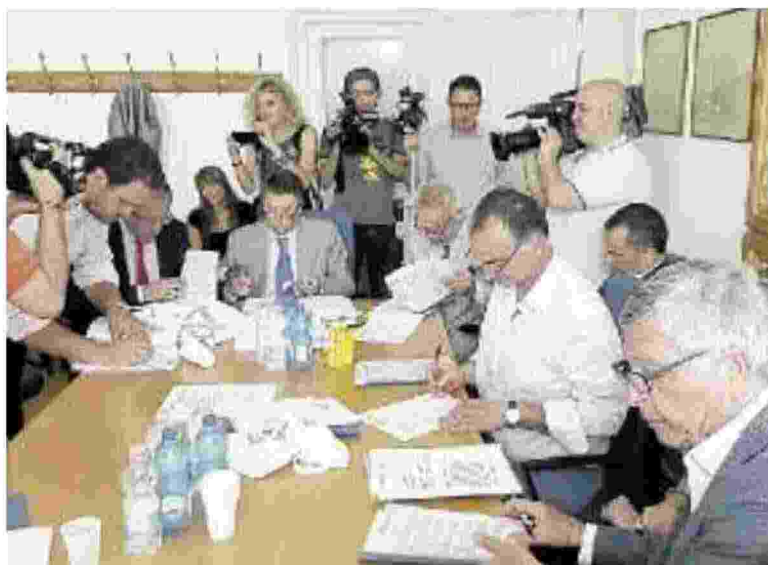
PROTOCOLLO È stato firmato ieri a Cividale

I SETTE GESTORI FVG SONO I PRIMI A LIVELLO NAZIONALE AD AVVIARE UNA COLLABORAZIONE DI QUESTO TIPO